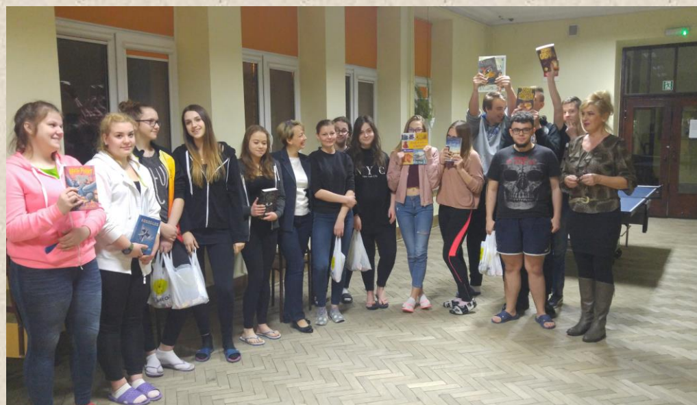
Zbiorowe zdjęcie uczestników konkursu.