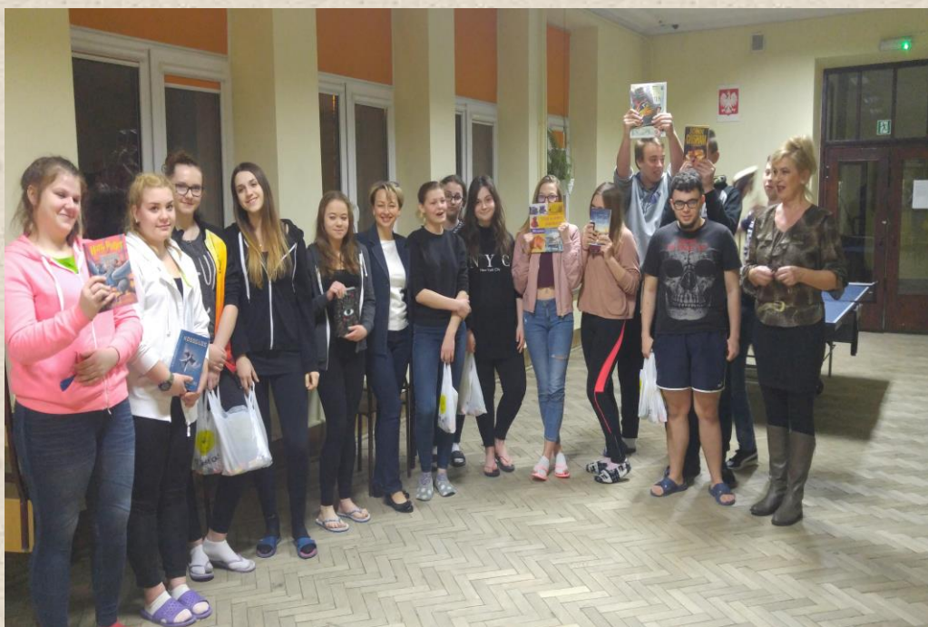
Zbiorowe zdjęcie uczestników konkursu.

Zapraszamy do udziału – czekają cenne nagrody.