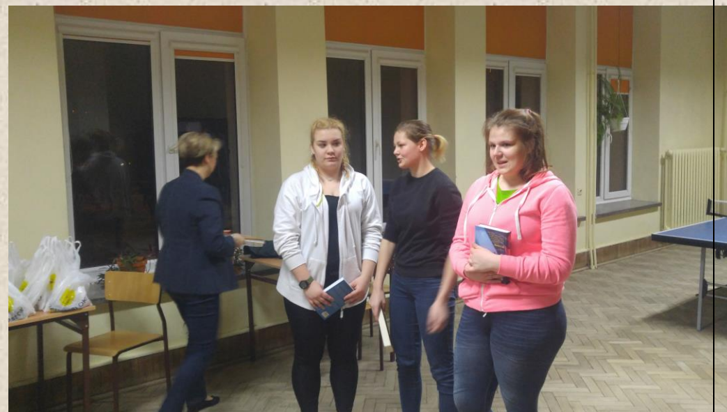
Pokój nr 117

Mieszkańcy w/w pokoi otrzymali nagrody w postaci książek ufundowanych przez Sponsora.