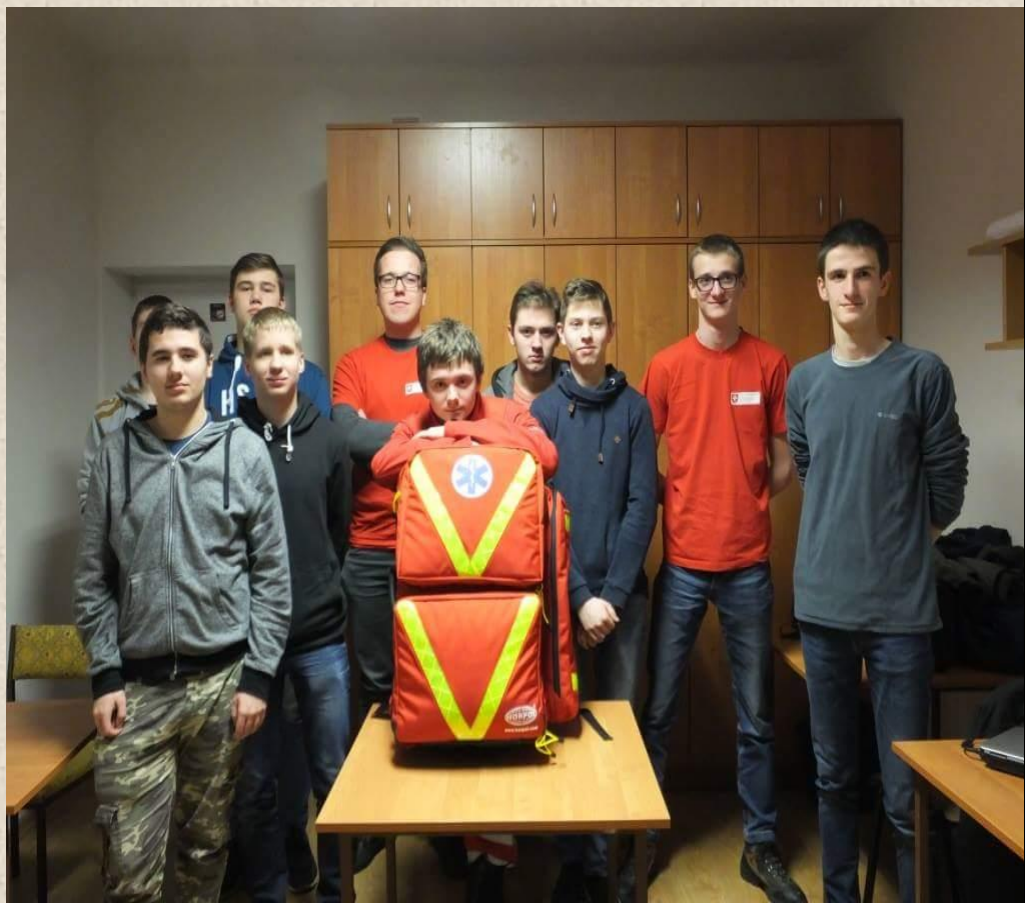
Spotkanie przedstawicieli Grupy VII z Wolontariuszami.