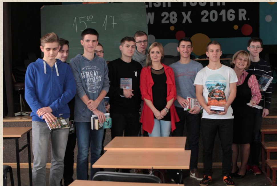
Finaliści konkursu wraz z organizatorami.