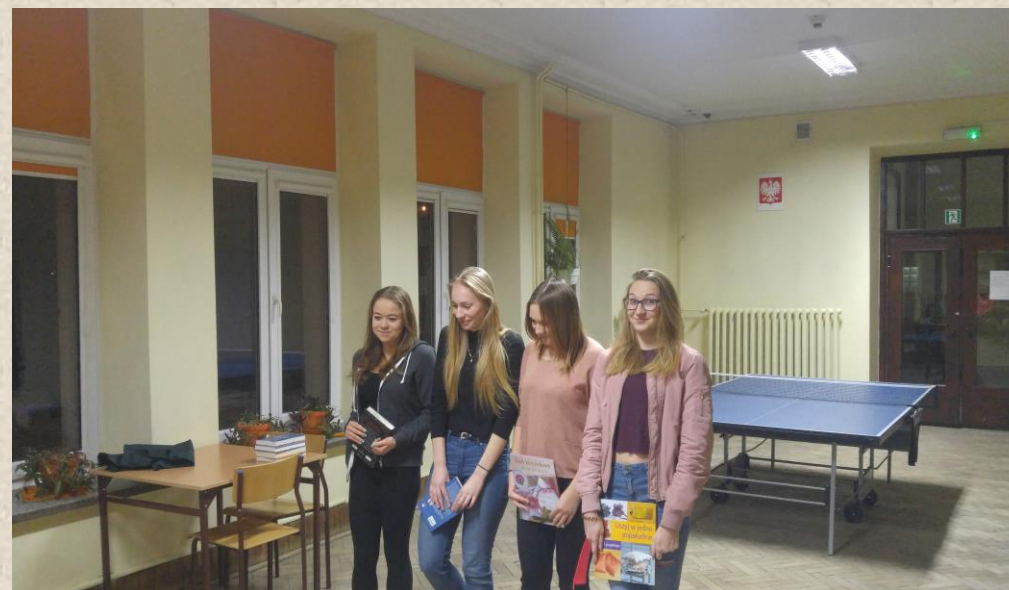
Pokój nr 111