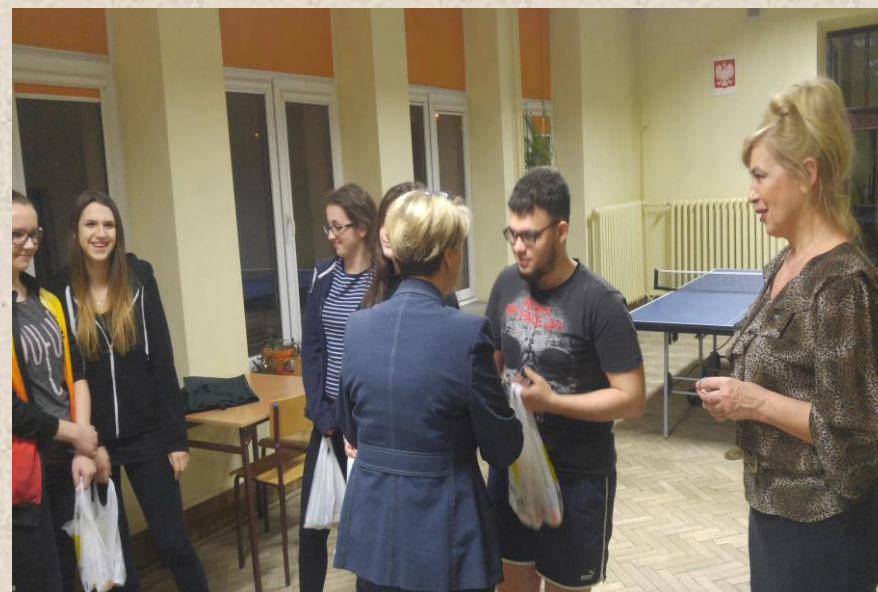
Pokój nr 123, 126, 219