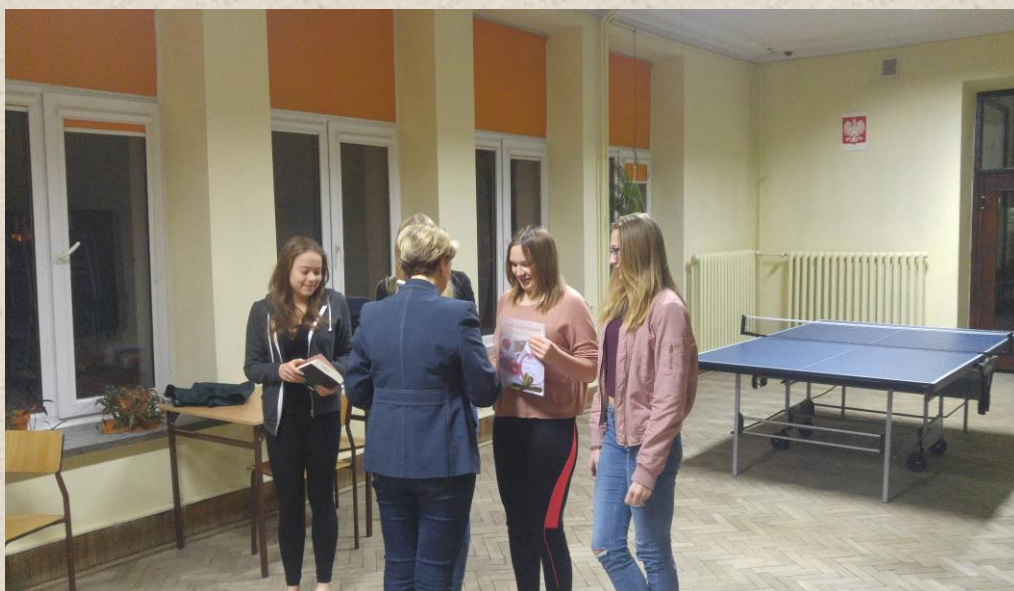
Pokój nr 111