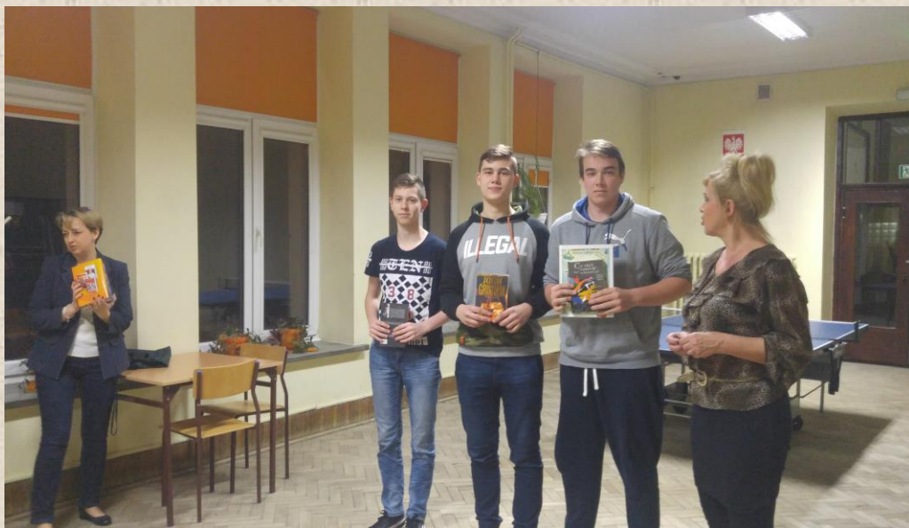
Pokój nr 114