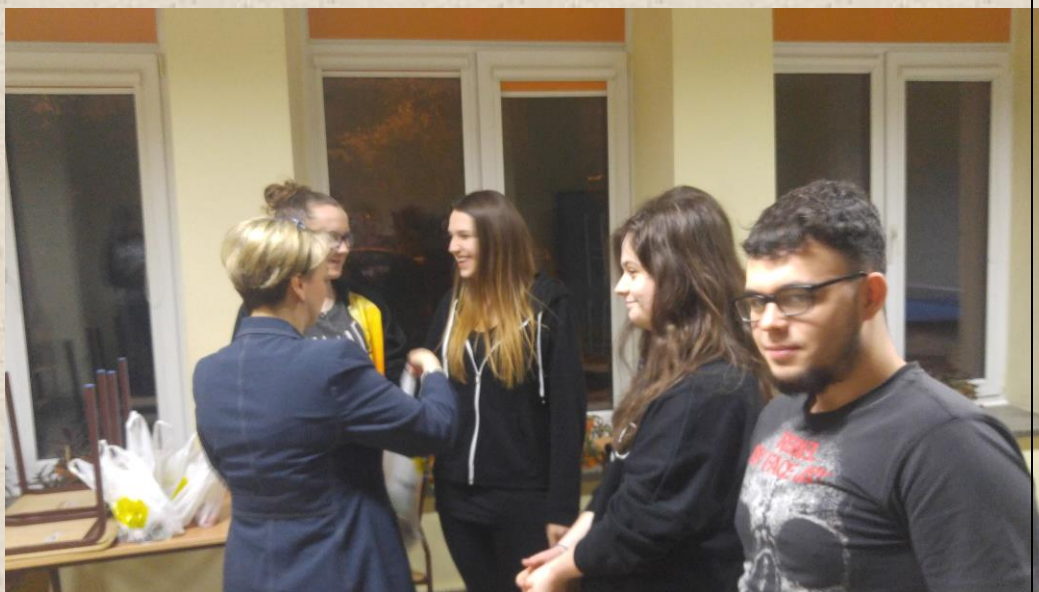
Pokój nr 123, 126, 219