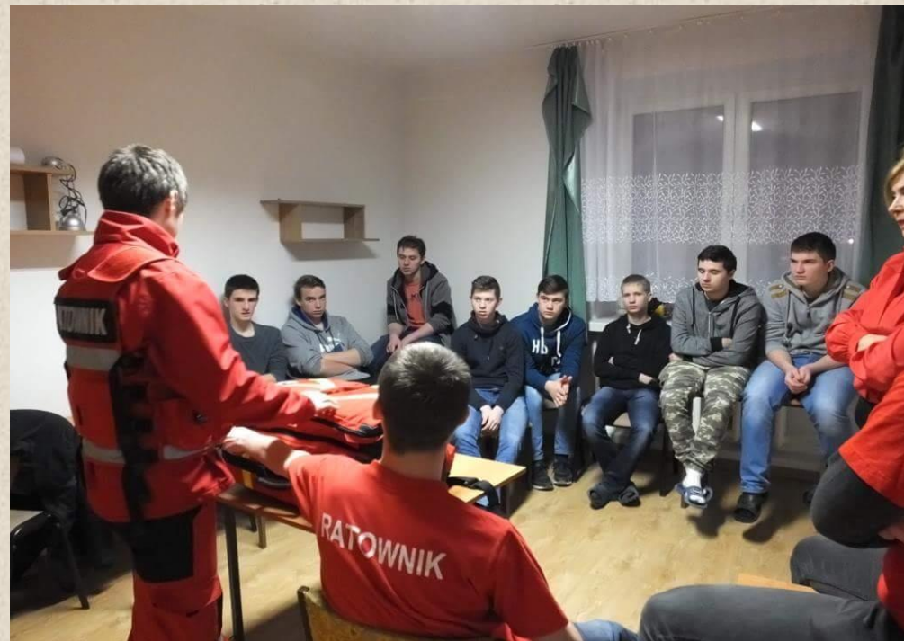
Spotkanie przedstawicieli Grupy VII z Wolontariuszami w czasie szkolenia medycznego.